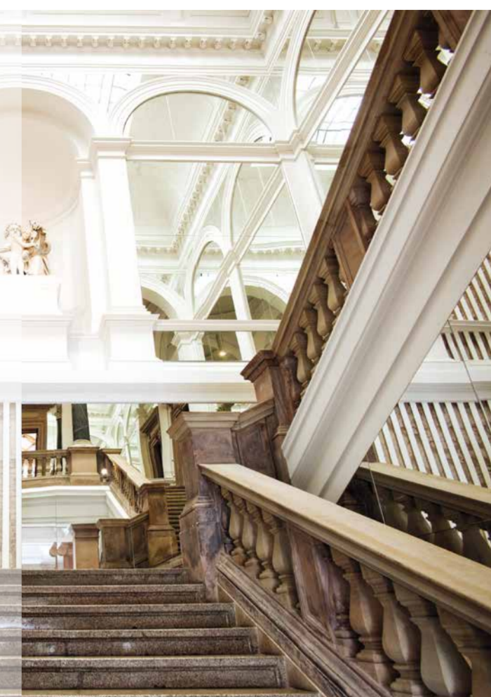
MUSEUM NEUES WEIMAR