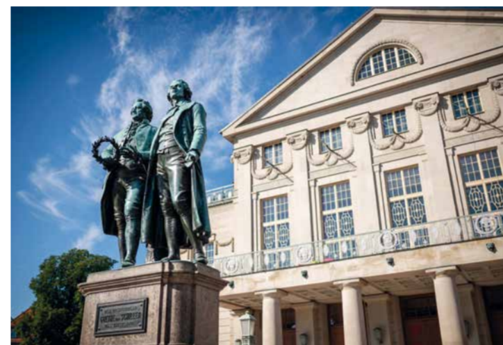
GOETHE-SCHILLER-DENKMAL VOR DEM DEUTSCHEN NATIONALTHEATER WEIMAR

Zahlreiche Höhepunkte setzen Akzente im Weimarer Sommer: Theater auf großen und kleinen Bühnen, Konzerte in Festsälen und als Open Air, leichte Muse und kreative Szene. In Weimar tritt auf, was Rang und Namen hat oder jung und talentiert ist.