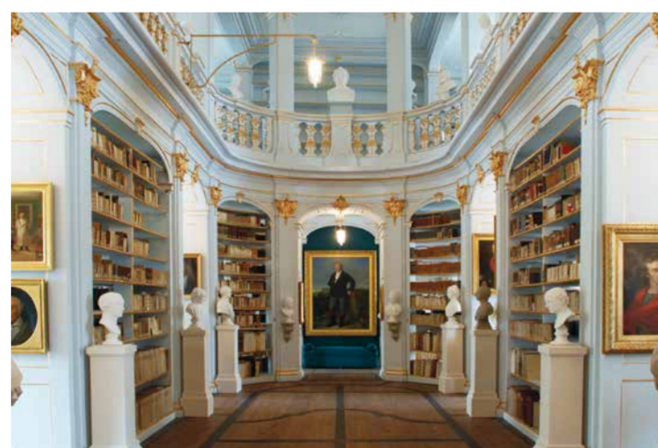
HERZOGIN ANNA AMALIA BIBLIOTHEK, ROKOKOSAAL