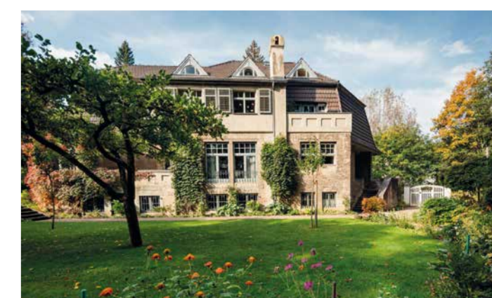
HAUS HOHE PAPPELN