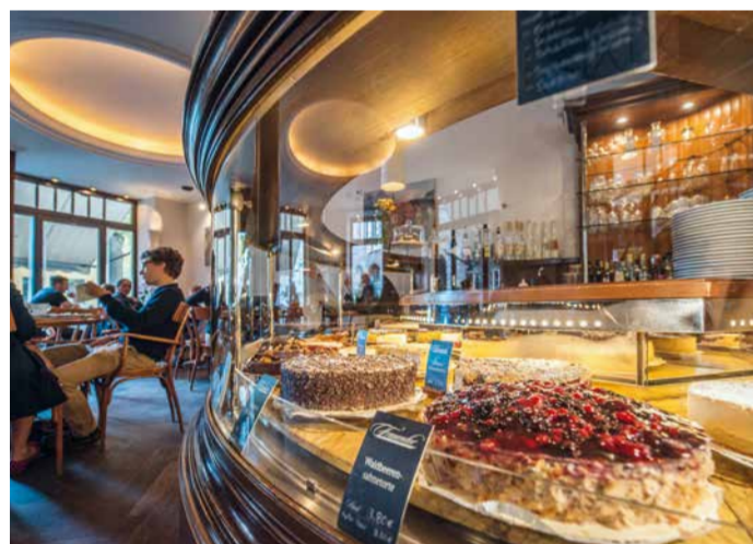
KUCHENAUSWAHL IM CAFÉ FRAUENTOR