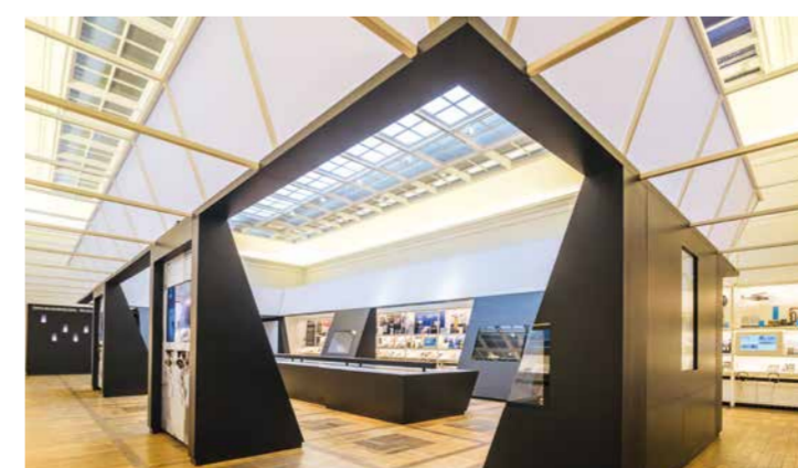
HAUS DER WEIMARER REPUBLIK